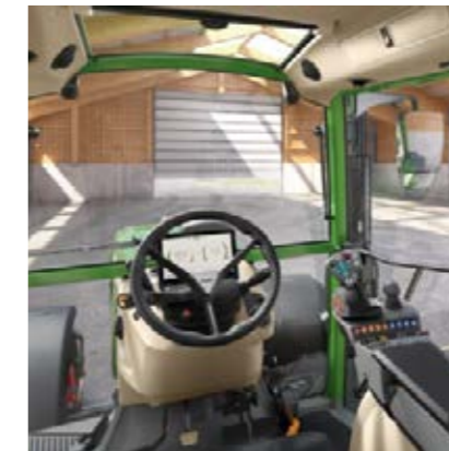
Profi Setting 1