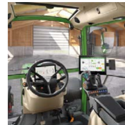
Profi Setting 2