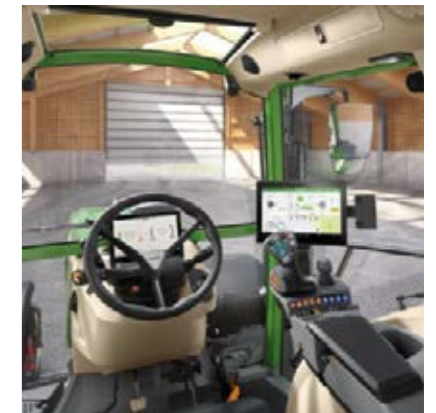
Profi+ Setting 1