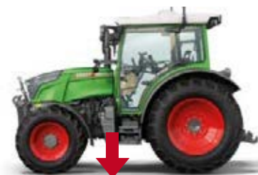
Fendt 211 Vario, 34 Kg./CV

La compactación del suelo reduce el rendimiento, tanto en la producción agrícola como en los pastos. Las amplias opciones de neumáticos y la baja relación peso-potencia del Fendt 200 Vario cuidan el suelo. Con tan solo 4280 Kg. o 34 Kg./CV, el Fendt 211 Vario es un verdadero peso ligero. Y puede lastrarse según sus necesidades. En la cabecera, podrá beneficiarse de su excelente maniobrabilidad con un radio de giro mín. de 4,2 metros.