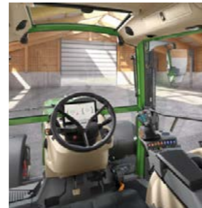
Power Setting 1

Puede elegir entre 2 configuraciones diferentes por cada nivel de equipamiento. Las imágenes muestran las diferentes líneas con accesorios opcionales.