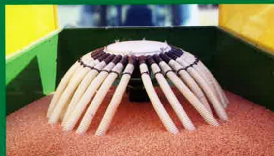
Tolva de 2.000 l. de capacidad. 2.000 l hopper capacity. Trémie de 2.000 l. de capacité.