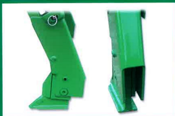
Reja en T con punta de tungsteno. T coulter with tungsten. Soc en T renversé avec tungstène.