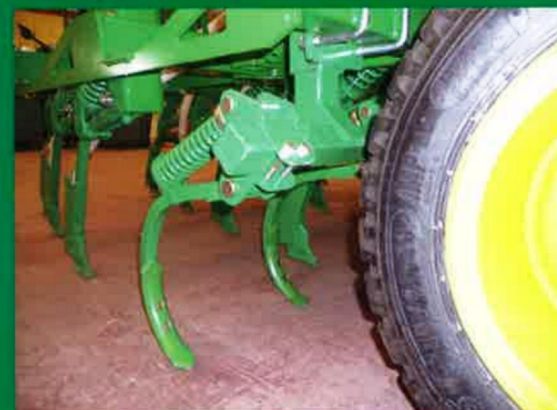
Borrahuellas. Track eliminator. Effaceur de traces.